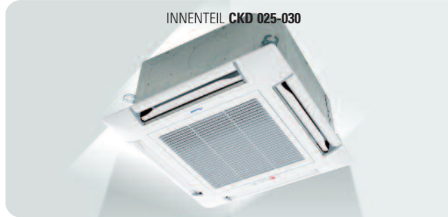
INNENTEIL CKD 025-030

2 Modelle Wärmepumpe von 8,0 kW bis 9,0 kW