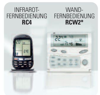
WAND- FERNBEDIENUNG RCW2*