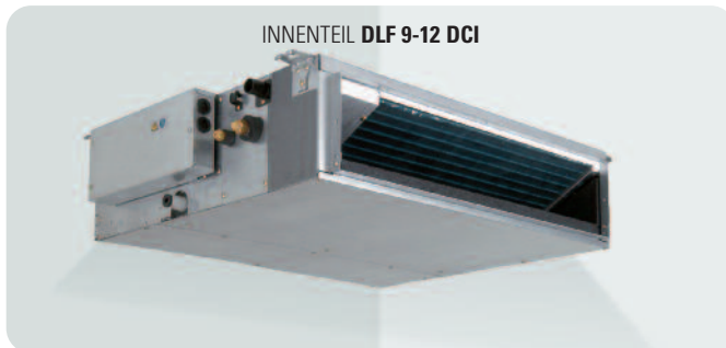
INNENTEIL DLF 9-12 DCI

2 Modelle Wärmepumpe von 3,4 kW bis 4,2 kW