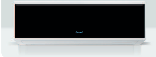
INNENTEIL HAF 009-012 DISPLAY SCHWARZ

2 Modelle Wärmepumpe von 2,8 kW bis 3,78 kW