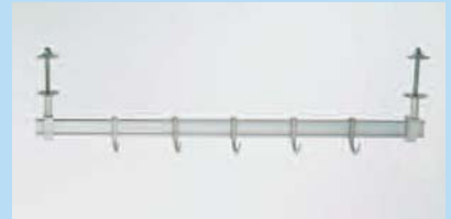
Fleisch- und Wurstgehänge für Deckenmontage