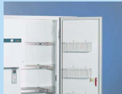
FHZ Standard mit optionalem Zubehör Hängekörbe und Rega Stabio (eingehängt)