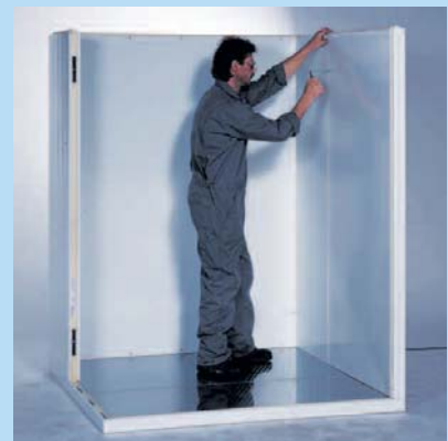
Einfache Montage der Zellelemente

Viessmann Frischhaltezellen verbinden beste Funktionalität mit höchstem Montage-Komfort! Die maßgenaue Schäumung der Zellelemente und die raffinierte Verbindung durch das Nut-/Federsystem mit selbstzentrierenden Exzenteranschlossern ermöglichen einen einfachen Selbstaufbau am Aufstellungsort. Auf Wunsch unterstützen Sie unsere Kältetechnik-Experten mit Rat und Tat bei Planung, Ausführung und Wartung Ihrer Viessmann Frischhaltezelle.