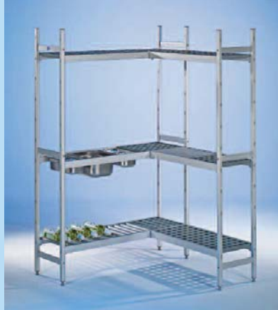
Regalsystem Rega Almo