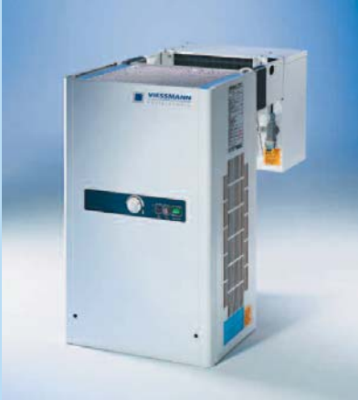
Huckepack-Aggregat mit T-Regelung