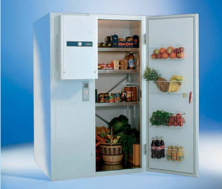
Frischhaltezelle Standard mit optional erhältlichem Zubehör Hängkörbe und Rega Stabio